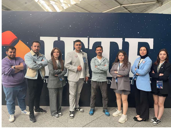
İFTE 2024 Fuar Etkinliği