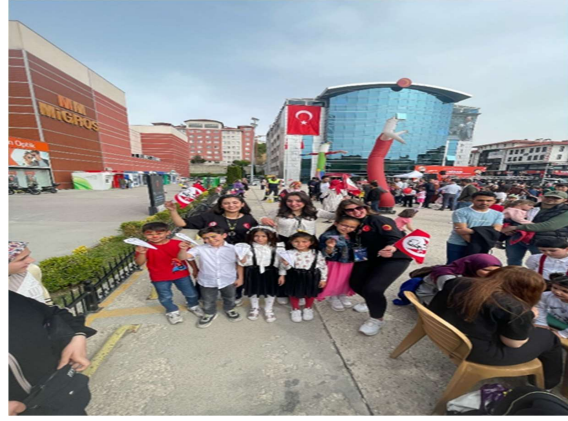
23 Nisan Kutlamaları