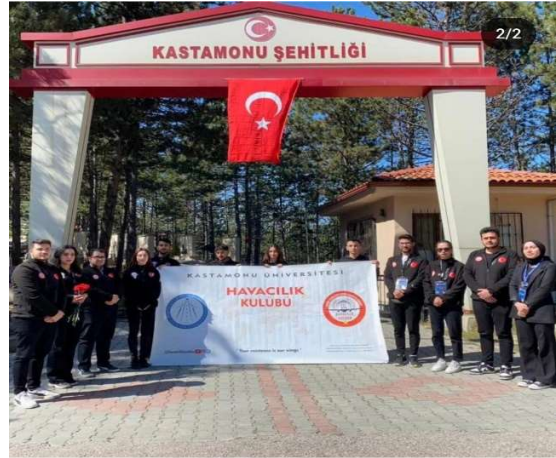
Şehitlik Ziyareti Etkinliği