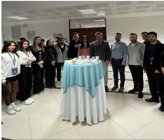
Dünya Sivil Havacılık Günü Konferansı