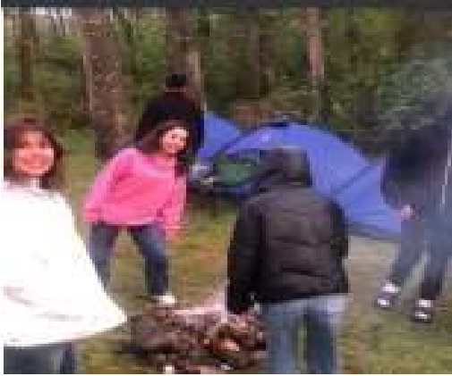
Sinop Kamp Etkinliđi