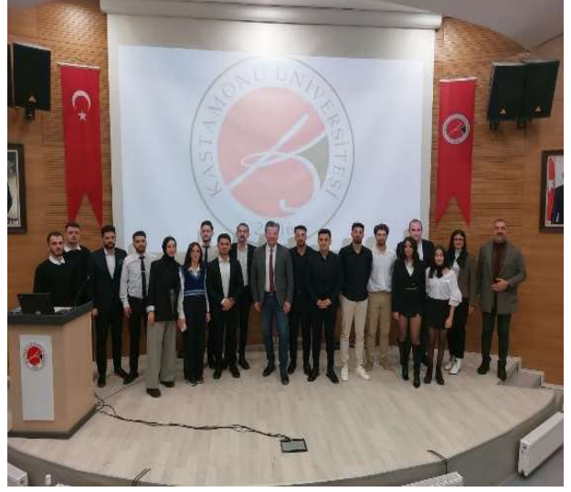
Liderlik Sunumları Etkinliği