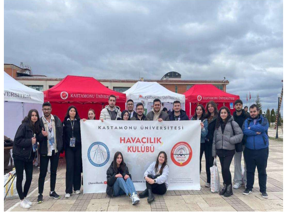
Stand Haftası Etkinliği