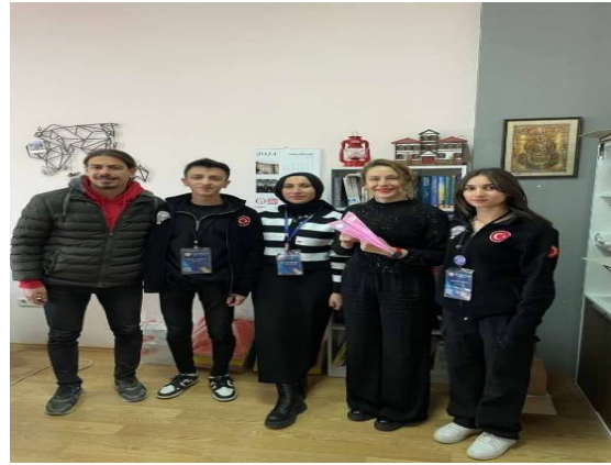
Dünya Kadınlar Günü Etkinliği