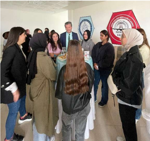
Hoş geldin Kokteyli