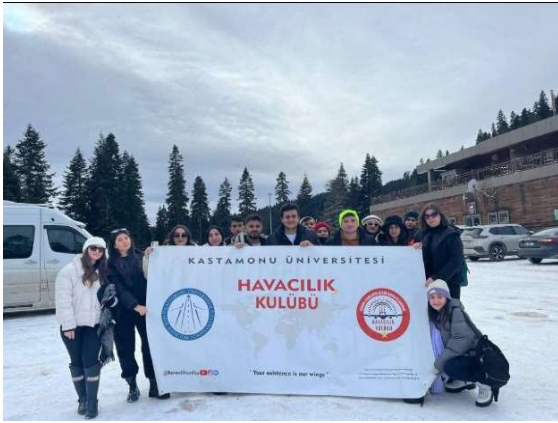
Ilgaz Dağı Kayak Merkezi Etkinliği