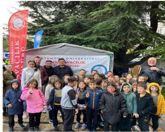
Kastamonu Bilim Şenliđi