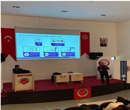
AFAD Eğitim Konferansı