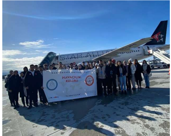
Kastamonu Havalimanı Teknik Gezisi