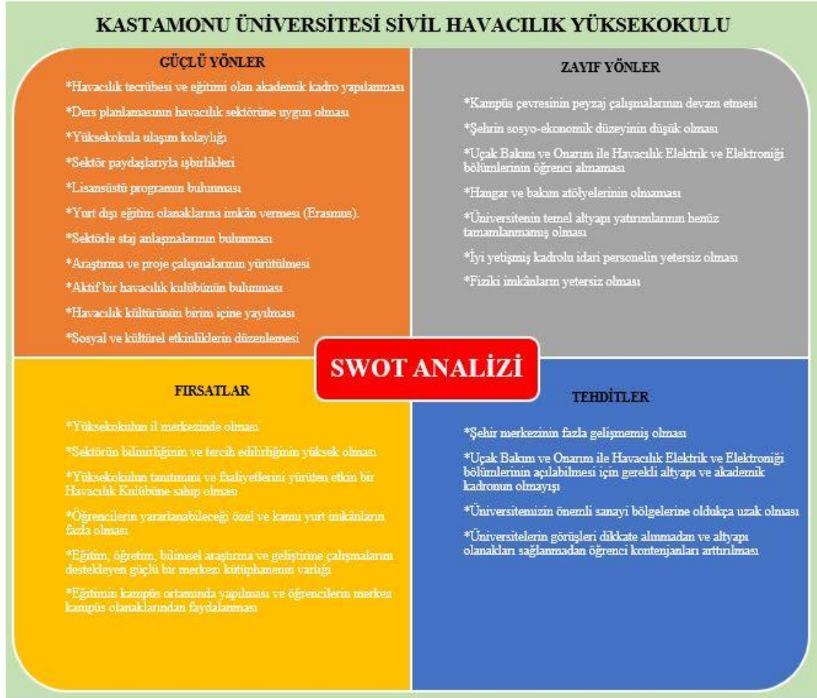
Şekil 1. Sivil Havacılık Yüksekokulu SWOT Analizi

Yüksekokulumuz, kurumsal yapıyı destekleyen, yenilikçi ve dönüşümcü yönetim anlayışına sahip liderlik tarzını benimsemektedir. Bu bağlamda iç değerlendirmeler ve paydaş değerlendirmeleri yapılarak iç kalite güvence sistemi oluşturulmaktadır. Yapılan değerlendirmeler neticesinde gerek gelişime açık yönlerimizin gerekse güçlü yönlerimizin farkında olarak maksimum verimlilik esasına dayanan yönetim anlayışı uygulanmaktadır. Bu doğrultuda birim SWOT analizi Şekil 1’de yer almaktadır.