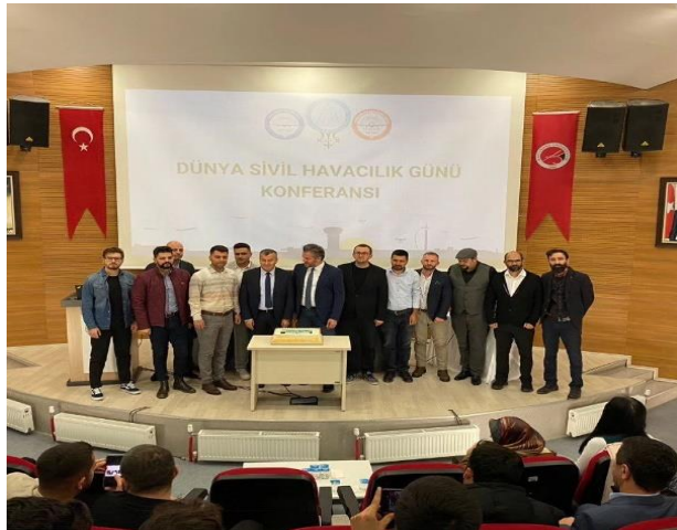
Dünya Sivil Havacılık Günü Konferansı