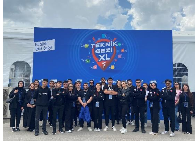
TUSAŞ XL Teknik Gezi