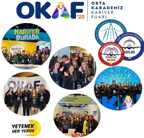
OKAF Fuar Etkinliği

Bilimsel, kültürel ve sanatsal faaliyetler ile ilgili görsellerin bazıları aşağıda sunulmaktadır.