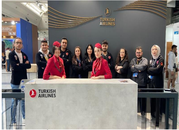
İFTE 2023 Fuar Etkinliği