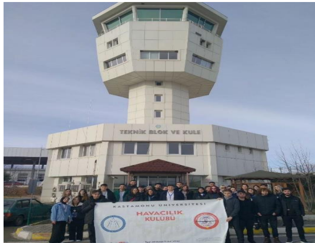
Kastamonu Havalimanı Teknik Gezisi